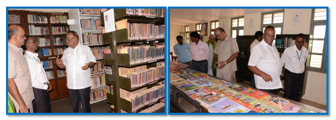
Guests at the Exhibition