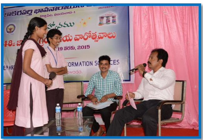
Spell out Competitions