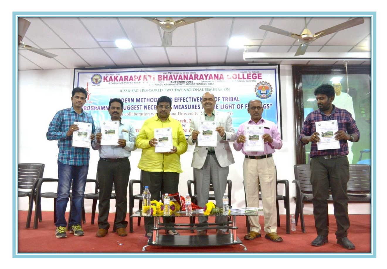
ISBN BOOK Release by delegates