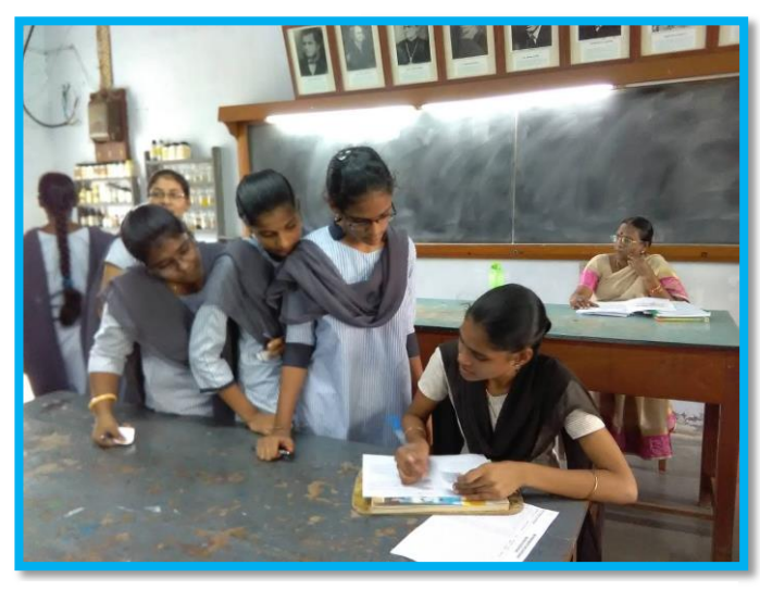
Students registering for blood group