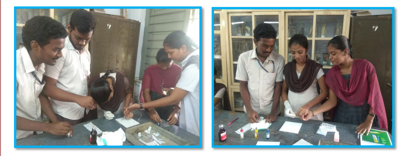
Collecting the blood drops from the students