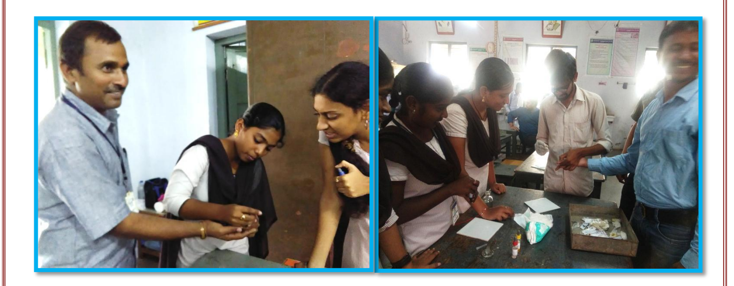
Collecting the blood drops from the faculty of KBNC