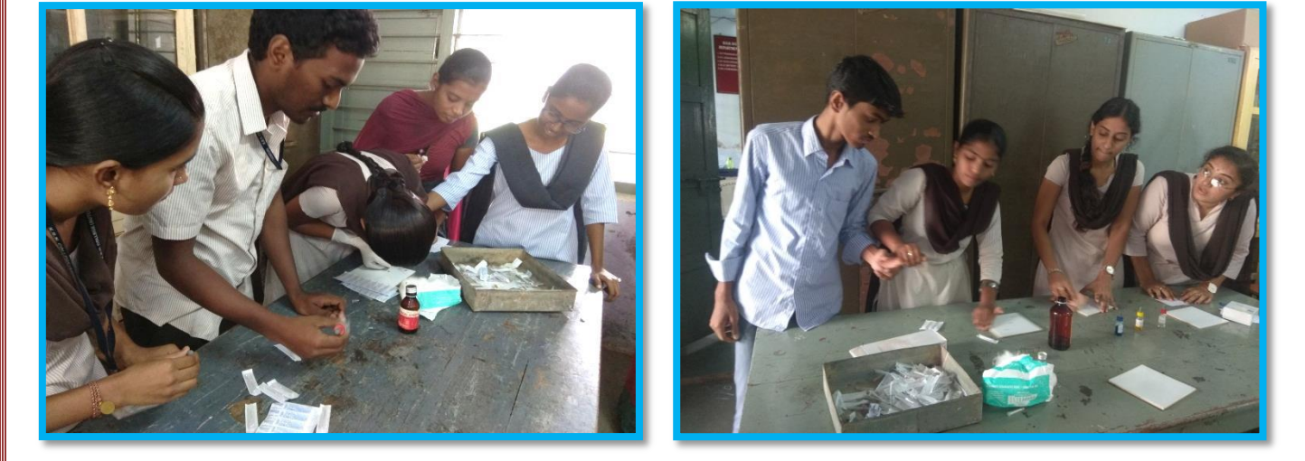
Students collecting the blood drops