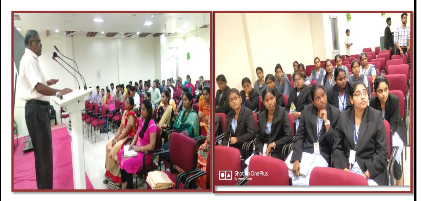
Students at the Guest Lecture