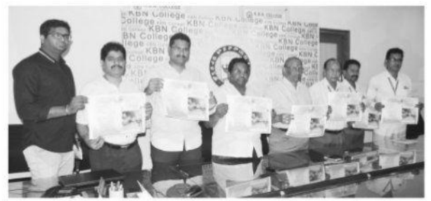
పాోస్టర్ ను ఆవిష్కరిస్తున్న పాలక సభ్యులు