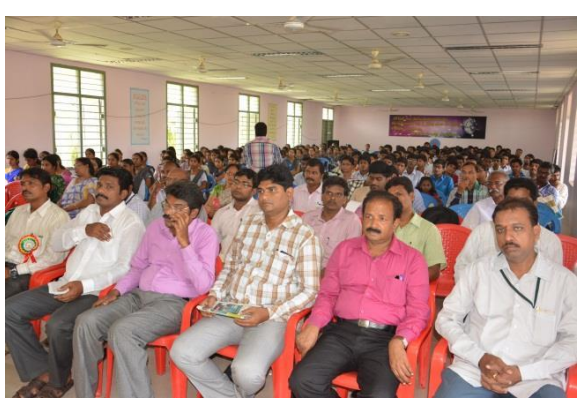
Staff & Students at the National Seminar