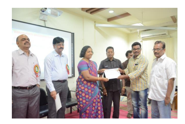
Certificates distribution to participants