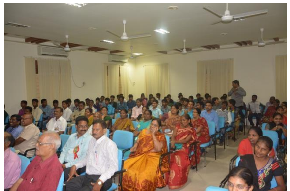
Participants at the National Seminar