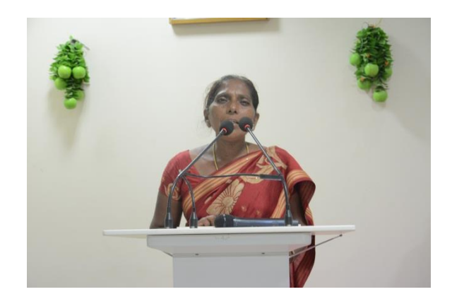
Feedback by participants