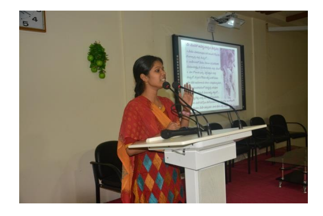
Student participating in the PPT presentation