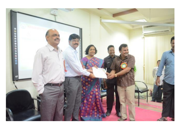
Certificates distribution to participants