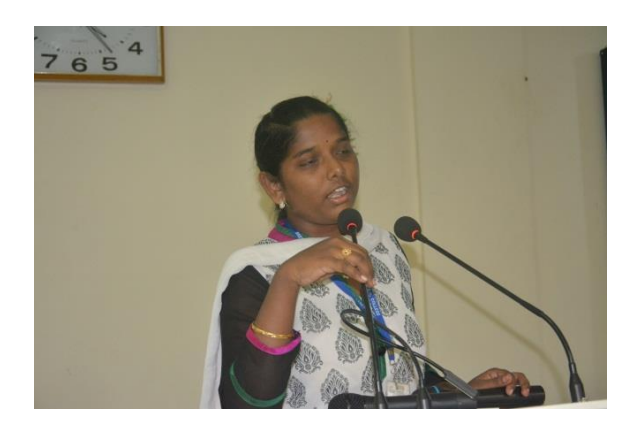
Student participating in the Oral presentation