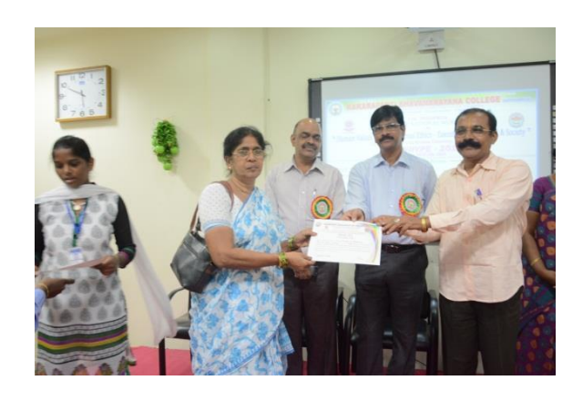
Certificates distribution to participants