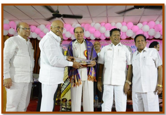
Felicitation to Padmasri Turlapati Kutumbarao