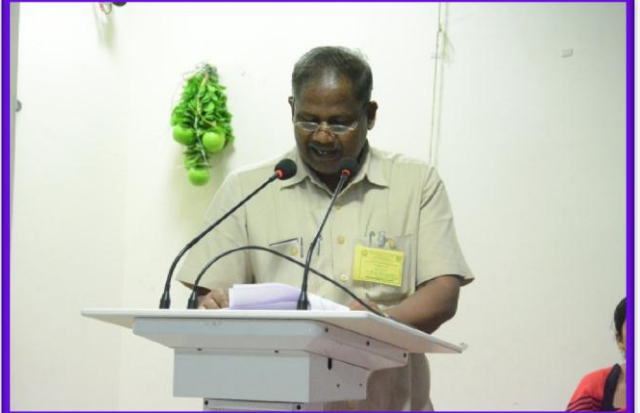
Paper presentation by the Participants