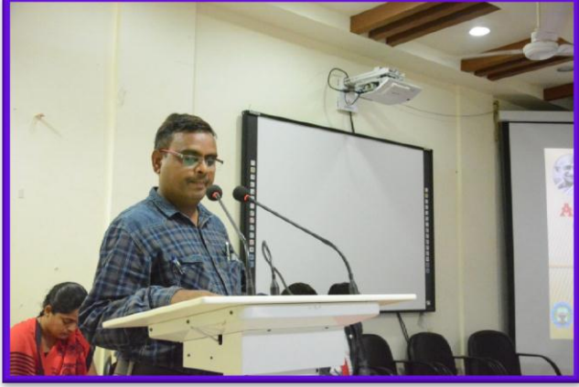
Paper presentation by the Participants