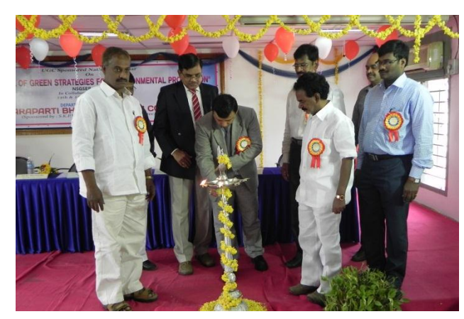
Lightening of the lamp by dignitaries