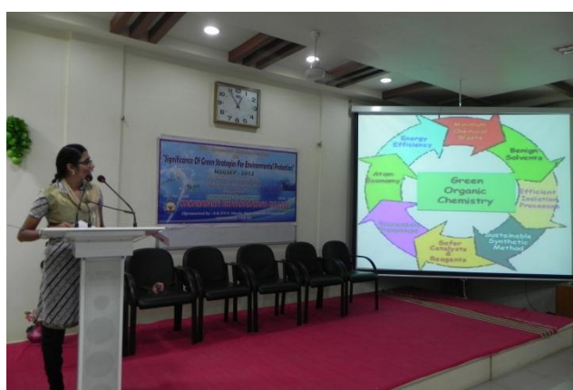
Power Point Presentation by the students