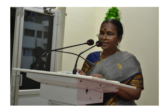
Conclusions by IQAC Convenor