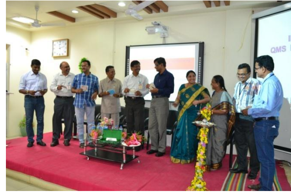
Distribution of Souvenier CDs