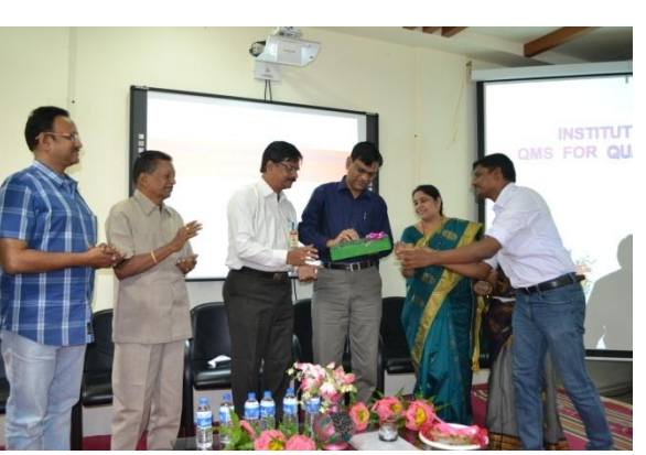
Release of Souvenier