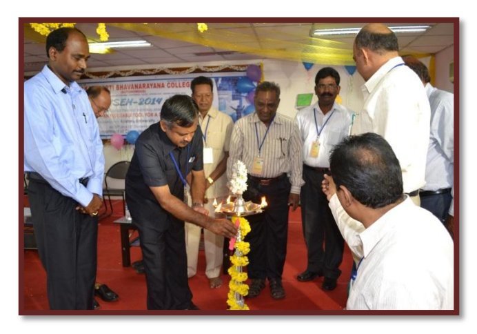
Lightening of the lamp by delegates