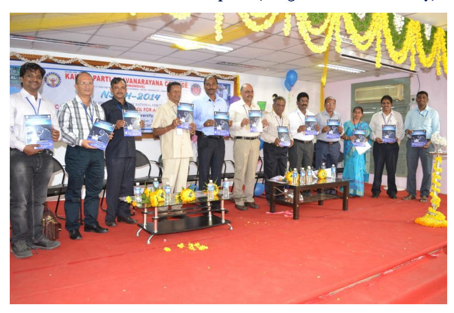
Release of Souvenir