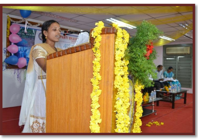
Introduction of the Chief Guest by Student