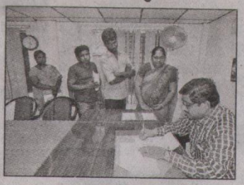
సమస్యలు వింటున్న నాయక్

కార్పారేషన్, స్కూస్టుడే: డ్రజ లకు అందించే మౌలిక సదుపా యాల కల్పనలో ఉత్పన్నమయ్యే ఇబ్బందులు, ఇతర సమస్యలను గుర్తించి వాటిని సత్వరమే పరిష్క రించేందుకు అను