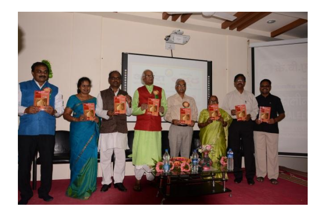
Release of souvenir