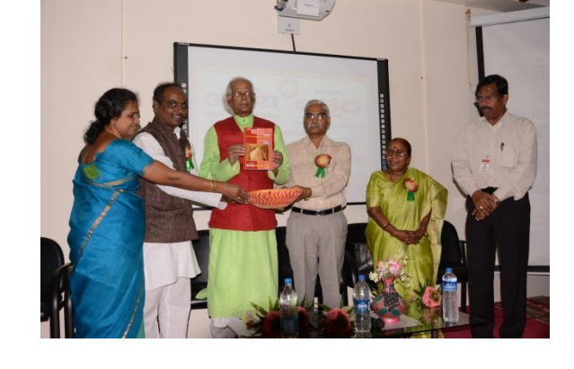
Release of souvenir