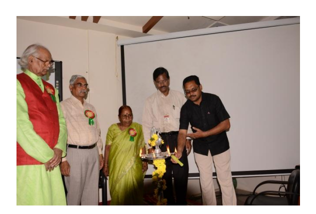
Lightening the Lamp by P. Devaraj Kumar