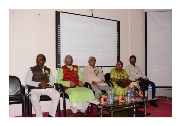
All the delegates on the dais