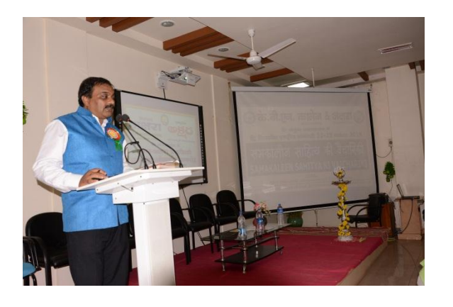
Explaining about the theme of the seminar