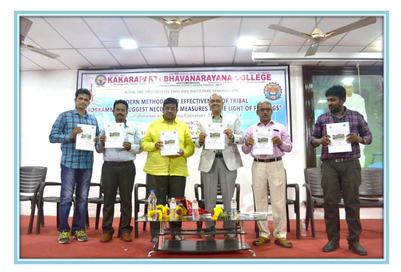
ISBN BOOK Release by delegates