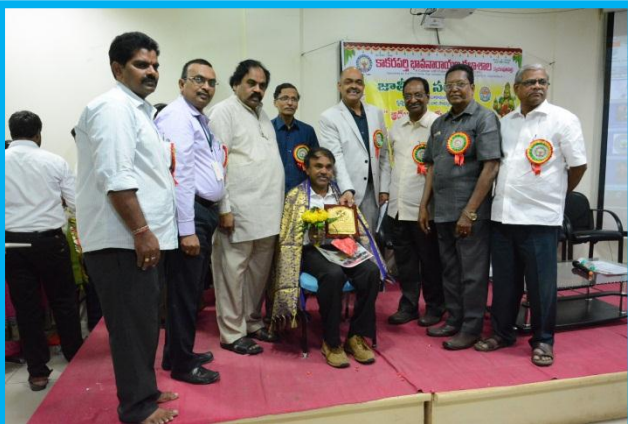
Felicitation to the Resource Person