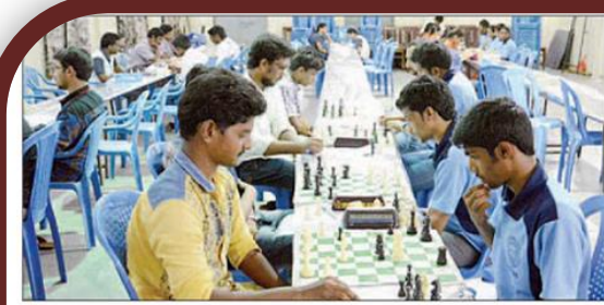
చెస్ టోర్మమెంట్ల్లో క్రీడకారులు