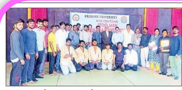
పోటీల్లో తలపడనున్న (కీడాకారులతో అధికారులు