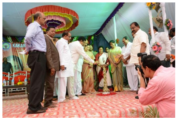
Lightening of the lamp by Honorable Ministers