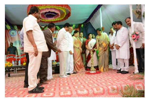
Lightening of the lamp by Honorable Ministers