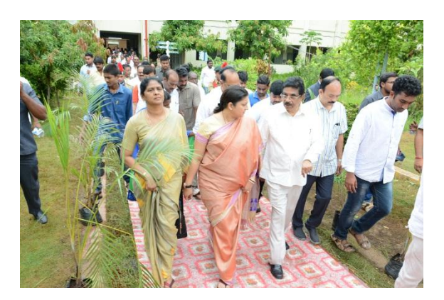
Honorable Minister on the way to Kalanikethan