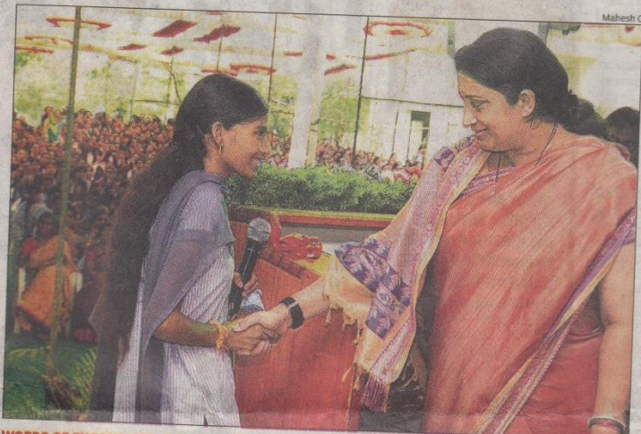
WORDS OF ENCOURAGEMENT: Union HRD minister Smriti Irani interacting with a girl student during a programme held at KBN College in Vijayawada on Tuesday

Constitution. Smriti Irani, who was on a whirlwind tour of the city on Tuesday, attended several programmes, including a visit to Gujarati Vidyalaya and inaugurating a science lab. She later spent about one hour interacting with students at KBN College. Reacting to a query posed by a student, the minister said that it was not possible for the Centre to enforce uniform syllabus. The student raised the issue keeping in view of the recent decision of Centre to implement the National Futures. of Centre to implement the National Entrance-cum-Eli-gibility Test (NEET) for me-dical admissions following the Supreme Court's judge-