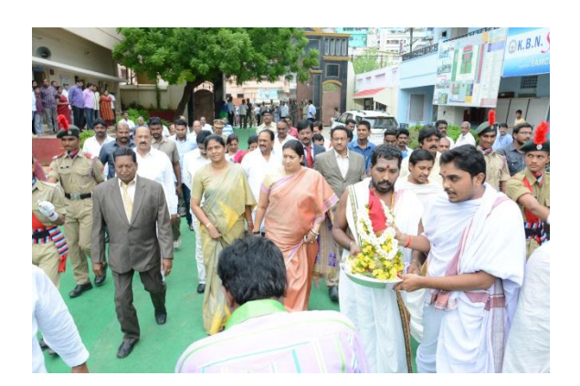
Vedic welcome to Smt. Smriti Jubin Irani, Human Resource Development Minister, Govt. of India