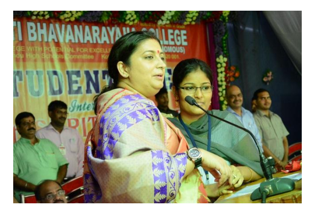
Smt. Smriti Jubin Irani, Human Resource Development Minister interacting with students