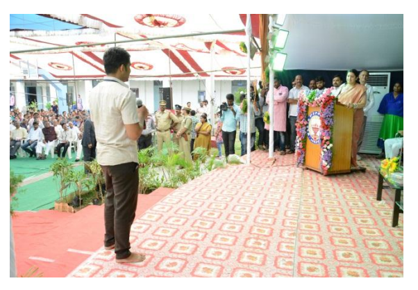
Smt. Smriti Jubin Irani, Human Resource Development Minister interacting with students