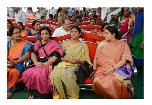
Honorable Minister at the Kalanikethan