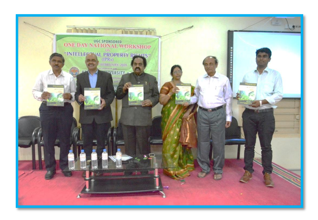
Release of Souvenir by the delegates