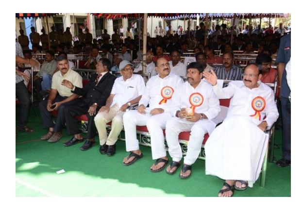
Ministers before inaugural session