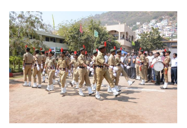
Guard of Honour by NCC Students to Chief Guest & Guests of Honour