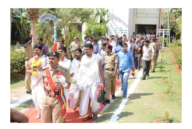
Vedic Swaghat to the guests