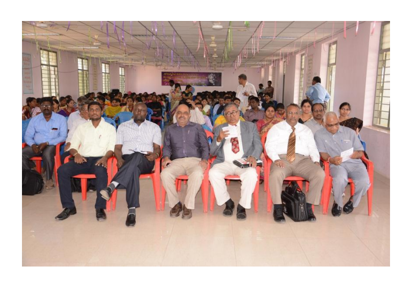
Resource persons in the PG Seminar hall