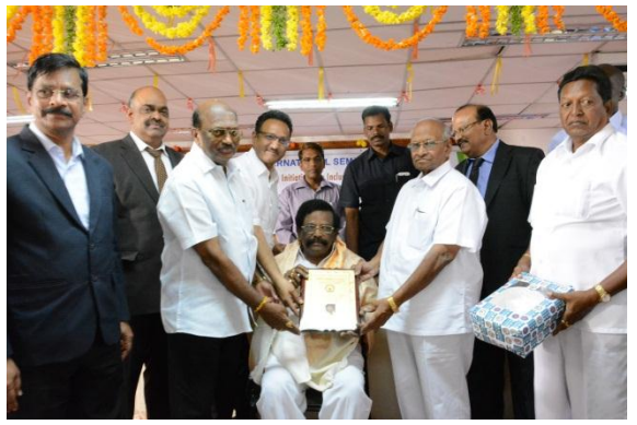
Felicitation to Sri. Siddha Raghava Rao, Hon'ble Minister for Transport, Roads & Buildings, Govt. of A.P