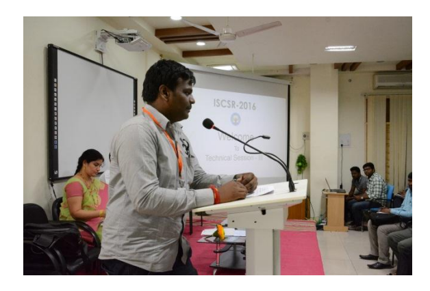
Paper Presentations by the Participants