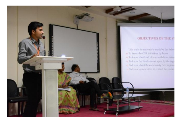
Paper Presentations by the Participants