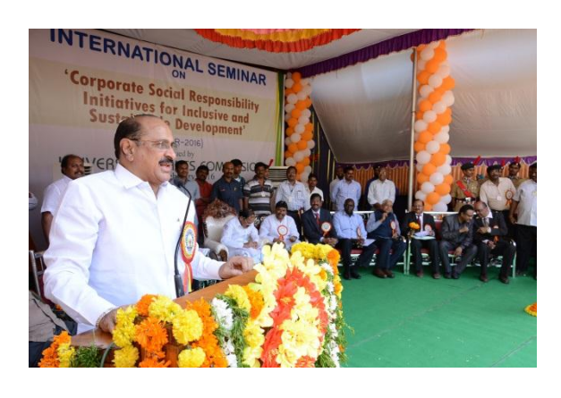
Speech by Hon'ble Minister Sri.Kamineni Srinivasa Rao