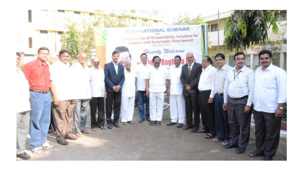
Sri. Siddha Raghava Rao, Hon'ble Minister with Committee members and faculty