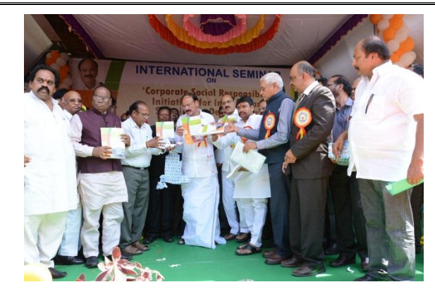
Release of Souvenir by chief guest & guest of honor