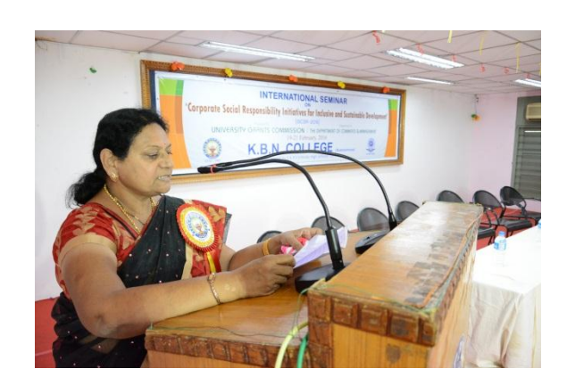
Inviting the Guests by Smt. A. Krishna Priya