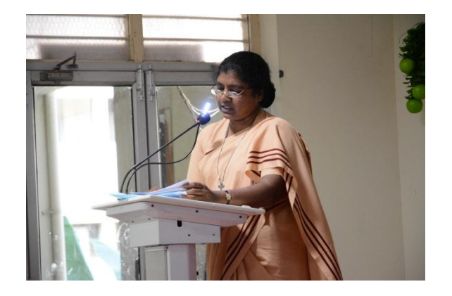
Paper Presentation by Lecturers