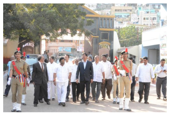
Arrival of Sri. Siddha Raghava Rao, Hon'ble Minister for Transport, Roads & Buildings, Govt. of A.P