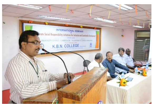
Introducing the guests by J. Panduranga Rao