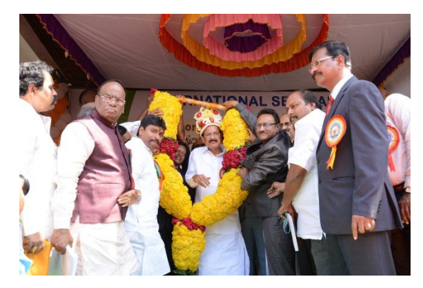
Felicitation to Sri. M. Venkaiah Naidu Hon'ble Minister for Parliamentary affairs & Urban Development, Govt. of India