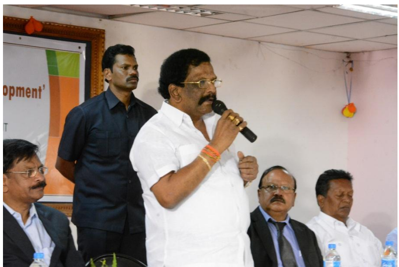
Valedictory Speech by Sri. Siddha Raghava Rao, Hon'ble Minister for Transport, Roads & Buildings, Govt. of A.P.