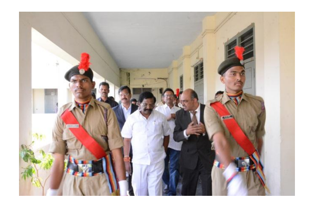
Guard of Honour by NCC Students to Chief Guest & Guests of Honour