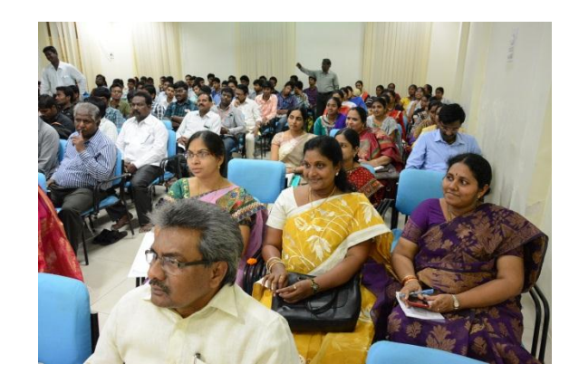
Guests of honor & Participants in the Seminar