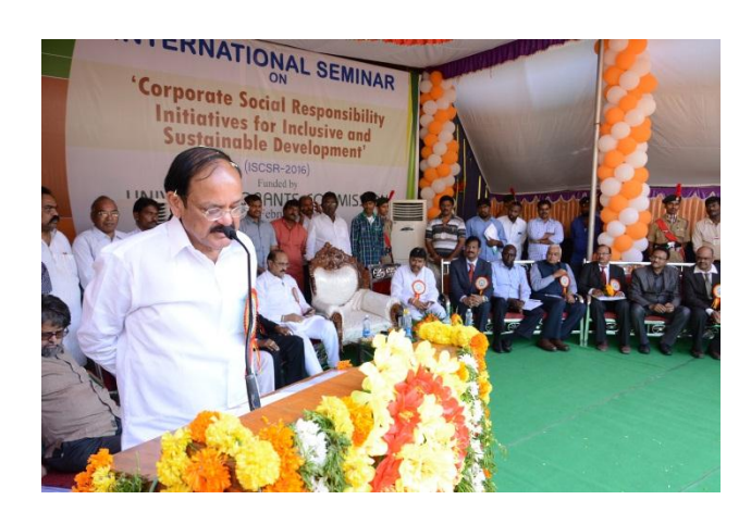
Sri. M. Venkaiah Naidu Hon'ble Minister for Parliamentary affairs & Urban Development, Govt. of India addressing the gathering at the inaugural function of ISCSR- 2016