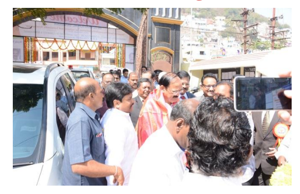
Arrival of Sri. M. Venkaiah Naidu Hon'ble Minister for Parliamentary affairs & Urban Development, Govt. of India