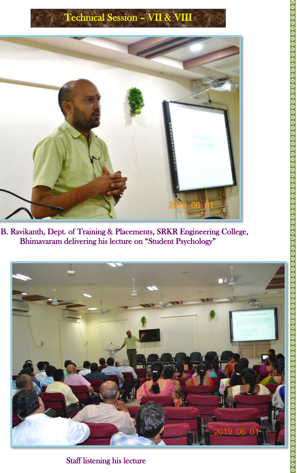
Staff listening his lecture