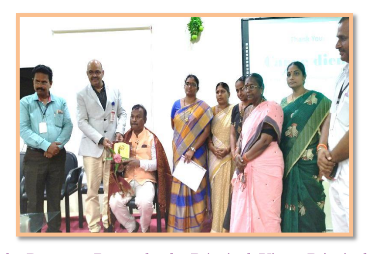
Felicitation to the Resource Person by the Principal, Vice - Principal & IQAC Members