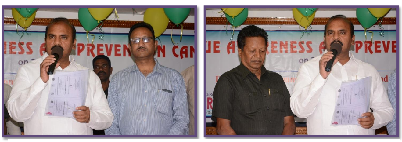
Speech by Sri. Prathipati Pulla Rao, Honourable Minister for Agriculture, AP